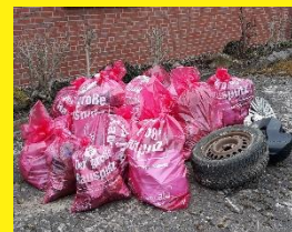
Ergebnis der Müllsammel-Aktion

Jedes Jahr im Frühjahr ruft der Verein zu einer gemeinsamen Müllsammelaktion rund um Holtensen auf. Im Anschluss gibt einen gemeinsamen Imbiss zur Stärkung.