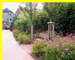
Beet an der Linderter Straße

In Holtensen gibt es viele öffentliche Grünanlagen, die von sog. 'Grünpaten' ehrenamtlich gepflegt und unterhalten werden.